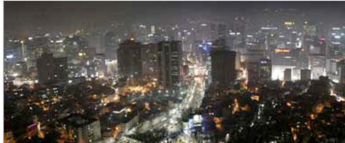
Stadt und Verkehr

Chinesische und deutsche Persönlichkeiten stellen ihre Visionen vor: Wie werden deutsche und chinesische Städte in 50 Jahren aussehen?